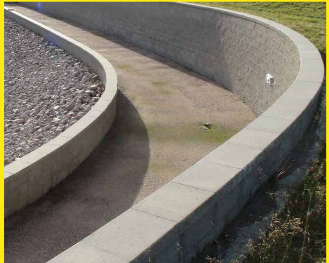
Genom att utnyttja höjdskillnaderna kan man skapa vackra terrasseringar som öppnar upp för funktion. Här har man förvandlat en obrukbar sluttning till en strandpromenad som löper längs sjön.