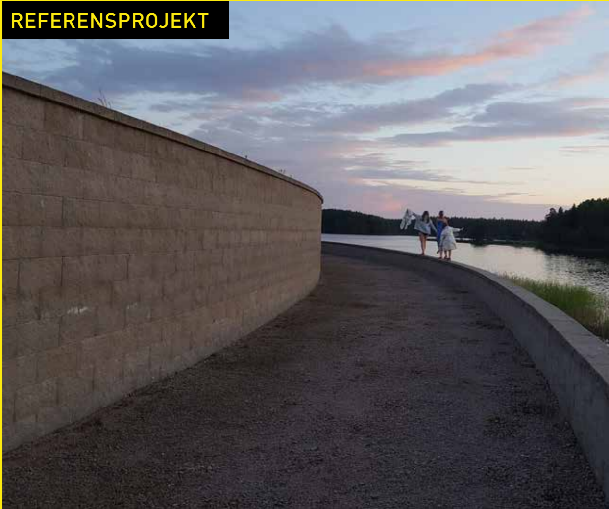
En härlig strandpromenad skapas med Compac mur på båda sidor.